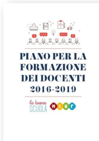
Reti di Scopo n. 4